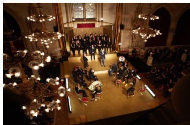
Österreichischer Filmpreis 2015, Wiener Rathaus