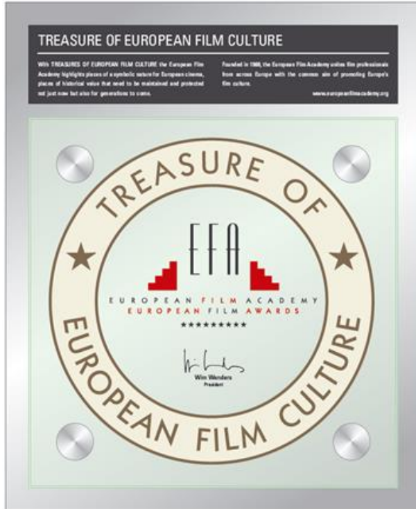
Emblem TREASURE OF EUROPEAN FILM CULTURE

Diese EFA-Filmkulturliste soll über die Jahre wachsen und auf öffentlich zugängliche Filmschauplätze aufmerksam machen – so wie das Wiener Riesenrad, weithin sichtbares Wahrzeichen der österreichischen Hauptstadt.